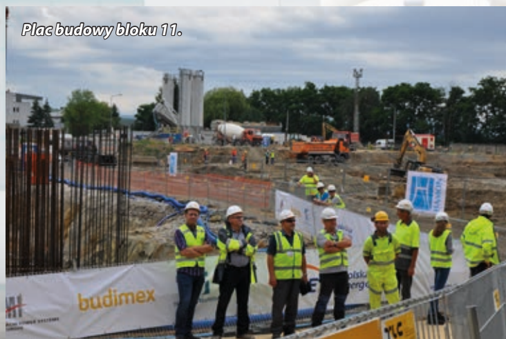
Plac budowy bloku 11.