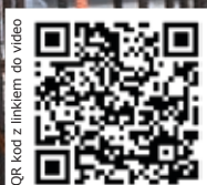
QR-kod z linkiem do wideo