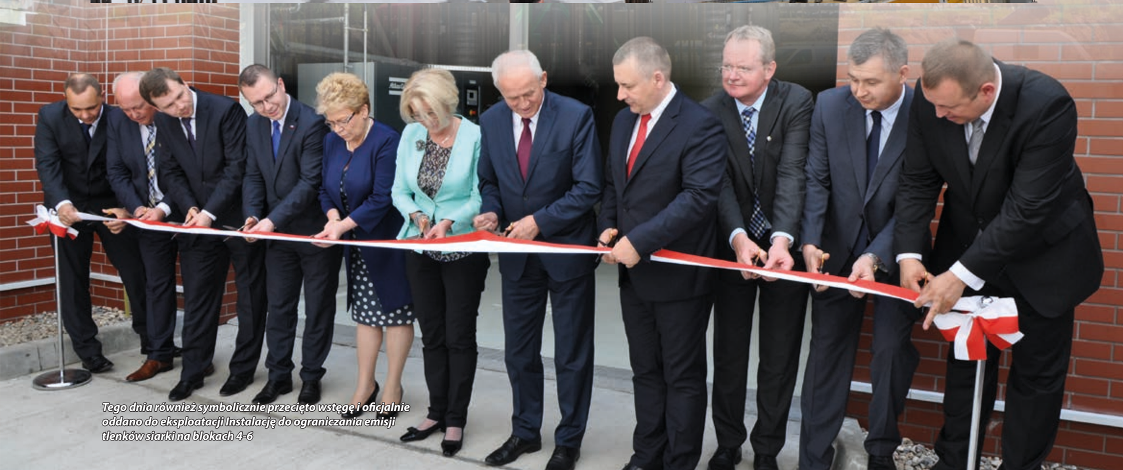
Tego dnia również symbolicznie przecięto wstęgę i oficjalnie oddano do eksploatacji Instalację do ograniczania emisji tlenków siarki na blokach 4-6