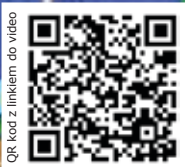
QR kod z linkiem do wideo