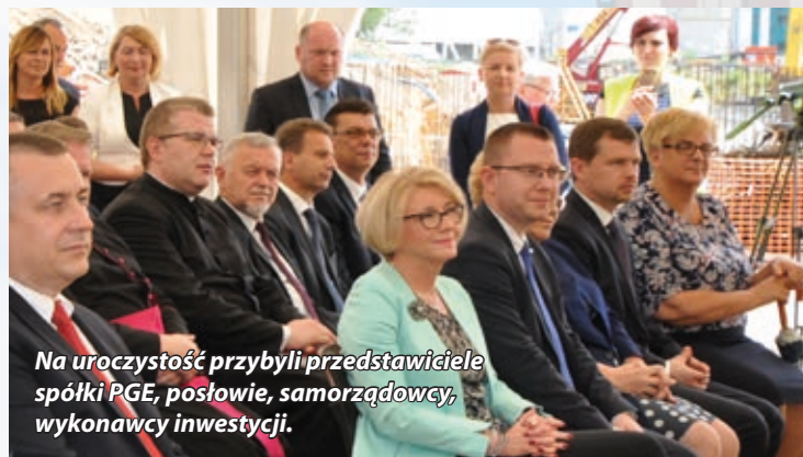
Na uroczystość przybyli przedstawiciele spółki PGE, posłowie, samorządowcy, wykonawcy inwestycji.

Realizacja tych projektów pozwoli Elektrowni Turów produkować energię w sposób efektywny i jeszcze bardziej przyjazny dla środowiska.