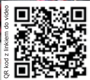
QR kod z linkiem do wideo