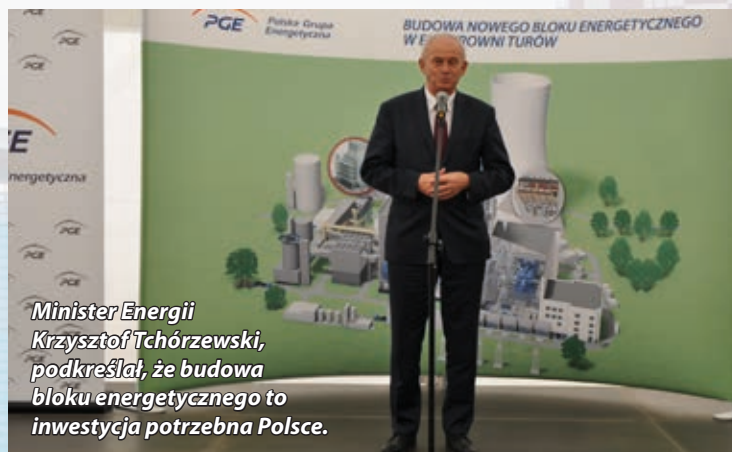
Minister Energii Krzysztof Tchórzewski, podkreślał, że budowa bloku energetycznego to inwestycja potrzebna Polsce.